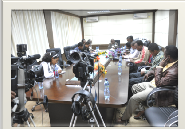
በጋዜጣዊ መግለጫ ወቅት