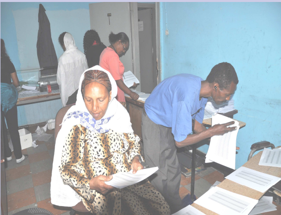
በዋናው መ/ቤት ስራተኞች