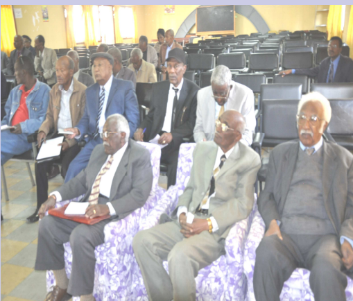
የአዲስ አበባ ጡረታዎች ማህበር እና የአዲስ አበባ ሪጅን ጽ/ቤት ከጡረታዎች ጭማሪ ጋር በተያያዘ በጋራ ለመስራት ውይይት ሲያደርጉ