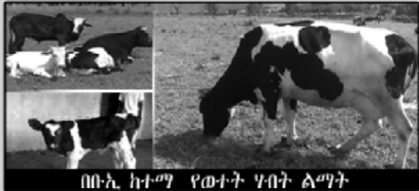
በቡሊ ከተማ የወተት ሃብት ልማት