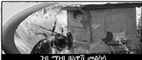
ገብ ማኅብ በአዋጅ መልካሳ