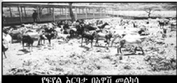
የፍየል እርባታ በአዋጅ መልካሳ