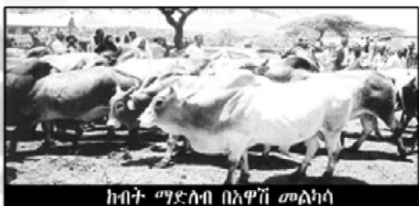
ከብት ማድላብ በአዋጅ መልካሳ