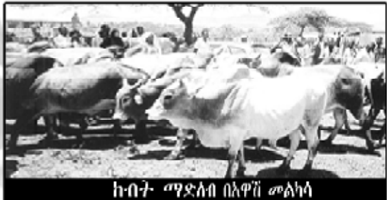
ኩባንያ ማደላብ በአዋጅ መልካሳ