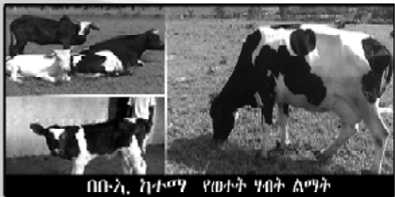
በቡ-ኢ ከተማ የወተት ሃሳብ ልማት