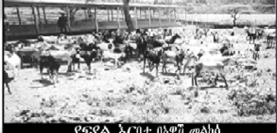
የፍጥራ አርባ በአዋጅ መልካሳ