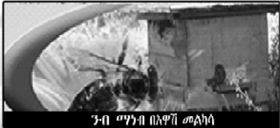
3-ባ ማንባ በአዋጅ መልካሳ